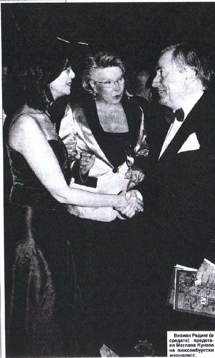
Вивиан Рединг (в средата) представя Меглена Кунова на люксембургски журналист.

емиграция в САЩ, тогава той печели президентските избори. Зад оквана той е работил като инженер и успява да се издигне до ръководен пост в американската Агенция за защита на окол-